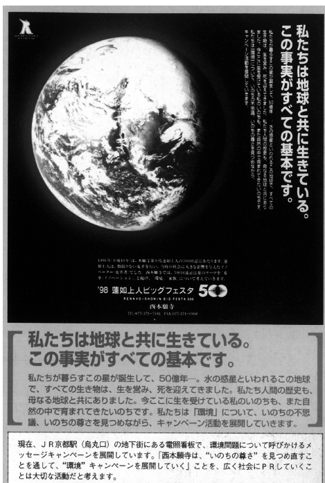
【図表4-1】蓮如上人500回遠忌法要のPRメッセージ（『'98蓮如上人ビッグフェスタ500情報誌 イノベーション通信』vol.3より）

宗門では、蓮如上人500回遠忌法要に向けたキャンペーンテーマとして「環境」が選ばれました。当時行われた環境問題への取り組みを広く呼びかけるPRメッセージには、「私たちは地球と共に生きている。この事実がすべての基本です」とあり、「いのちの不思議」「いのちの尊さ」を見つめ直すことによって環境問題に取り組んでいく姿勢が示されています（→【図表4-1】蓮如上人500回遠忌法要のPRメッセージ）。